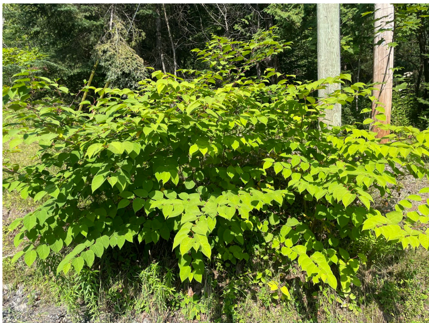
Renouée du Japon au lac Napoléon

L'emplacement et la grosseur des herbiers de Renouée du Japon ont été documentés. Aucun contrôle n'a encore été effectué. Les acteurs attendent de savoir s'il serait pertinent d'en faire et si oui, quel serait le meilleur moyen.