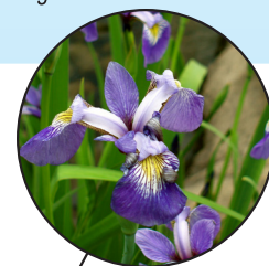
Iris versicolore Iris versicolor