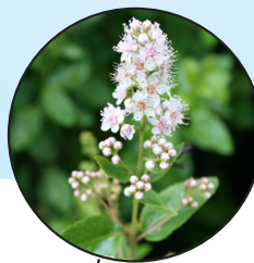
Spirée à larges feuilles Spiraea latifolia