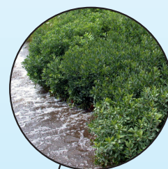
Myrique baumier Myrica gale

Un repère visuel pourrait vous aider lors de vos travaux. Téléchargez cette affiche au www.crelaurentides.org