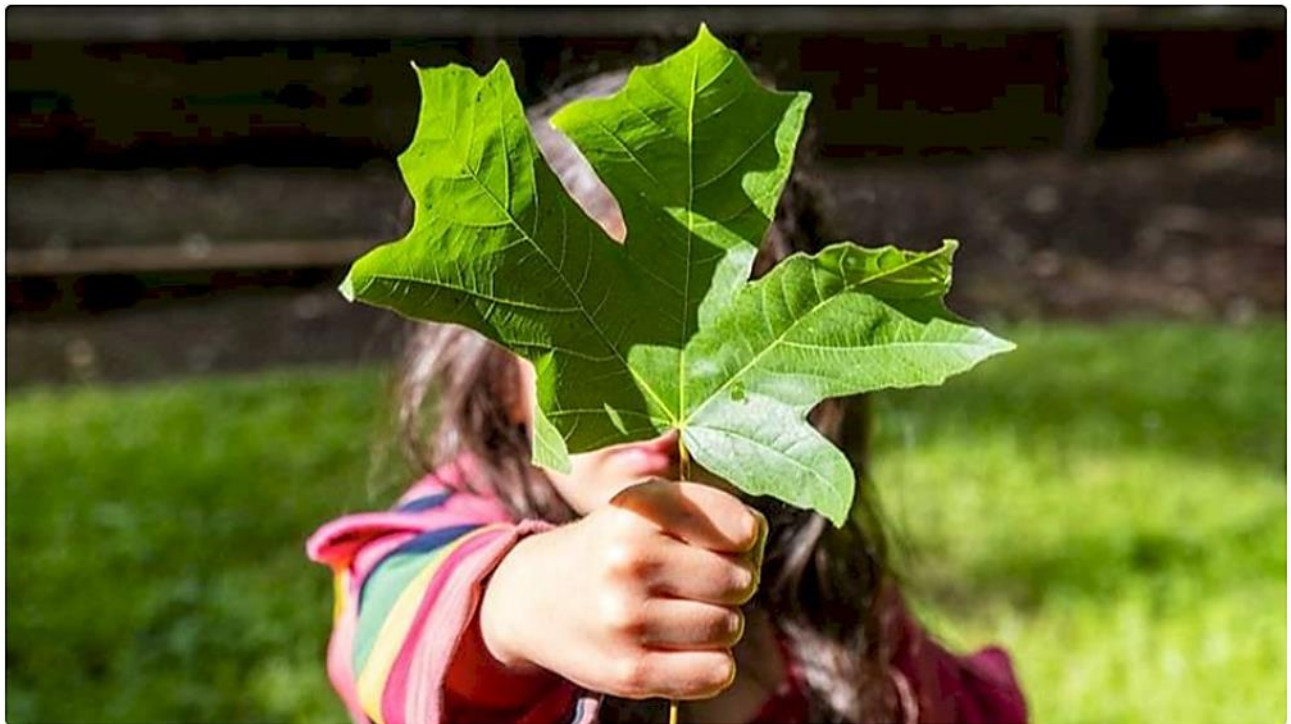
Conseil régional de l'environnement des Laurentides