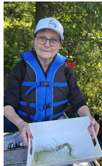
Figure 2. Protocole de caractérisation des plantes aquatiques au lac Loiselle

Des protocoles du RSVL ont été effectués à plusieurs lacs lorsque les bénévoles le demandaient. Parmi ces tests, l'échantillonnage de la qualité de l'eau a été effectué au lac Loiselle, et la mesure de transparence de l'eau avec le disque de Secchi a été réalisée à plusieurs lacs lors du protocole de détection des PAEE.