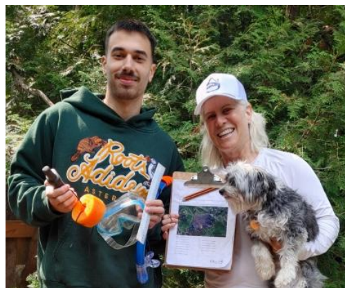
Figure 1. Suivi du périphyton au lac Marois

Le rapport de suivi du périphyton des lacs de Sainte-Anne-des-Lacs a été mis à jour avec les données recueillies en 2025. Celui-ci présente les résultats des 11 lacs de la Municipalité pour lesquels le suivi du périphyton a été réalisé depuis 2016.