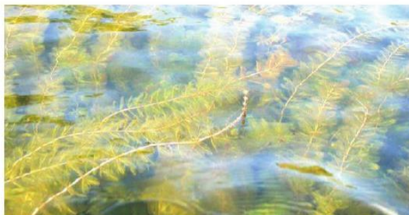
Le myriophylle à épi est une plante qui peut empêcher la tenue d'activités nautiques dans les lacs qu'il infeste.