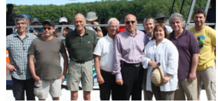
Neuf des treize membres du conseil d'administration 2012-2013

L'équipe du CRE s'agrandit pour la saison estivale!