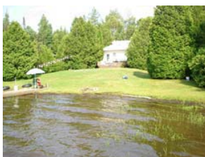
Terrain gazonné jusqu'au bord de l'eau au lac Tamaracouta, été 2006