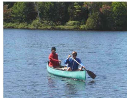
Mesures d'épaisseur de périphyton au lac Tamaracouta le 26 août 2006.

Six riverains et moi avons caractérisé la bande riveraine d'une baie, et ce, dans le but de les former à refaire ce protocole dans le futur. De plus, ils se sont familiarisés avec les termes et l'équipement requis pour faire les protocoles. Ils ont aussi été formés pour le protocole du substrat. Nous avons fait la caractérisation de l'épaisseur du périphyton de tout le lac. La journée s'est très bien déroulée et les gens ont apprécié d'avoir une aide technique pour leur expliquer et les guider dans leur analyse.