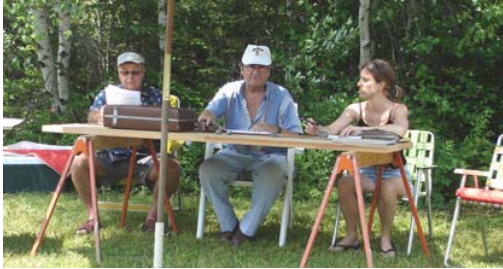
Assemblée du lac Daïnava le 9 juillet 2006.