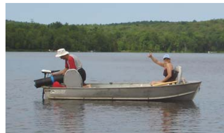
Caractérisent le substrat du lac Paul le 3 juillet 2006