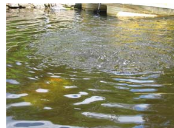
Aérateur totalement submergé au lac Daïnova. (photo prise le 8 août 2006)

L'association fait une réunion par année. Il n'y a pas de comité environnement sur ce lac.