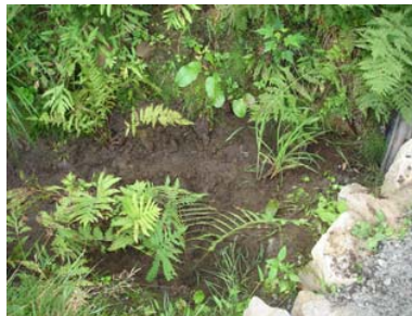
Ruisseau après la renaturation.

J'ai réalisé l'objectif de donner de l'information sur les saines pratiques d'aménagement en rive, mais en utilisant un autre moyen de partage d'information que par la présentation d'ateliers.