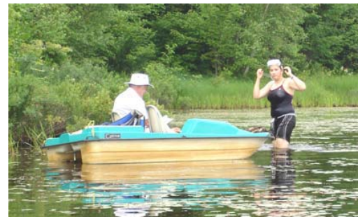
Caractérisation du périphyton au lac Paul