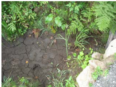
Ruisseau avant la renaturation.

Au lac Tamaracouta, des riverains se plaignaient d'avoir plus d'algues cet été que les années passées. Je leur ai donc proposé de revégétaliser une partie du ruisseau se jetant dans le lac au niveau de la zone problématique afin de retenir les nutriments qui descendent de la montagne. Stéphane Carrier et moi avons donc planté des plantes de milieux humides sur les bords du ruisseau.