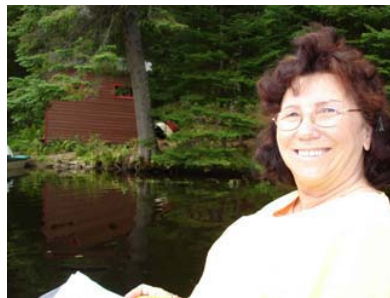
Caractérisation de la bande riveraine du lac Daïnava le 16 août 2006.