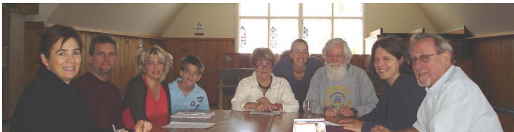
Deuxième réunion pour la formation d'un comité environnement au lac Tamaracouta.