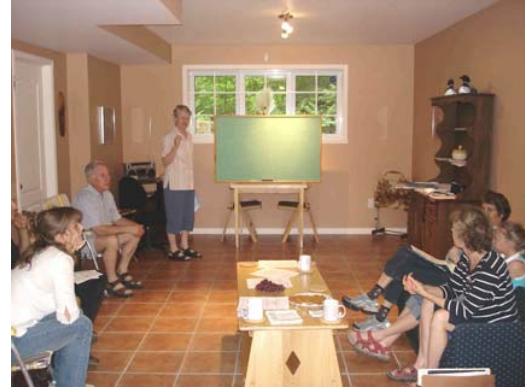
Formation sur les protocoles de caractérisation et planification des dates de réalisation de chaque protocole avec le comité environnement du lac Paul le 17 juin 2006.

J'ai organisé et tenu une journée de formation et de planification de deux protocoles (périphyton et substrat) avec les gens du comité environnement. Cette rencontre a eu lieu chez le coordonnateur du comité environnement. Huit personnes étaient présentes à cette journée de formation. De plus, nous avons pris des photos de toute la rive pour compléter la caractérisation de la bande riveraine. Lors des journées de caractérisation, nous avons travaillé à quatre ou cinq équipes de 2 personnes. Ainsi, nous avons réalisé la totalité du lac pour les protocoles du substrat et du périphyton. Suite aux caractérisations de l'été 2006, environ 10 personnes sont aptes à faire ces deux protocoles. Les responsables, assureront le suivi de l'état de santé du lac en effectuant les protocoles dans les années futures.