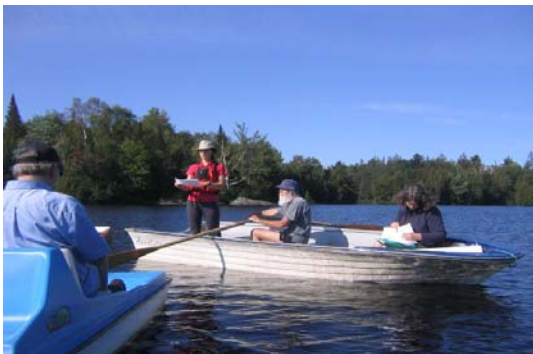
Journée formation sur les protocoles au lac Tamaracouta le 26 août 2006.