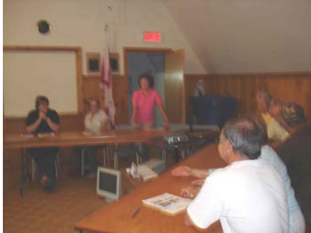
Conférence du 18 août 2006 avec les riverains du lac Fiddler.

De plus, je suis allée à la réunion annuelle de la Spinney Recreation Association. Je leur ai donné de l'information générale et un résumé des analyses physico-chimiques du lac Fiddler.