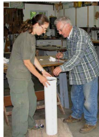
Fabrication d'un aquascope le 27 juin 2006.

En somme, j'ai caractérisé, avec l'aide des riverains, un minimum d'une partie du lac pour trois des quatre lacs ciblés, et ce, pour un ou plusieurs protocoles. Seul le lac Fiddler n'a pas eu de caractérisation. Je considère donc que j'ai réalisé, en tenant compte de la volonté du milieu, l'objectif de caractériser au moins un secteur de chaque lac avec des riverains. Deux lacs (Paul et Tamaracouta) continueront de faire les protocoles dans les années futures. La pérennité du suivi est donc assurée par la présence d'un comité environnement.