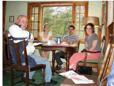
Réunion de la Spinney Recreation Association (27 août 2006)

Au début de l'été, j'ai rencontré le promoteur, le directeur-ingénieur et quelques employés du développement immobilier « Fiddler Lake Resort ». Ces gens ont été informés des règles par rapport aux respects de la végétation en rive, mais ils semblent les avoir tout de même transgressées. L'inspecteur et le MDDEP feront un suivi auprès du Fiddler Lake Resort.