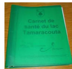
Carnet de santé du lac Tamaracouta.

Dans le cas du lac Tamaracouta, les riverains se connaissent depuis plus longtemps et beaucoup ont des liens familiaux. Il est alors plus facile de former des groupes et démarrer un comité environnement. Je leur ai aussi préparé et donné un carnet de santé du lac contenant toutes les informations sur les protocoles de caractérisation, de l'information sur le programme de suivi volontaire du MDDEP et mes feuilles résumées des protocoles. Ils ont aussi la version électronique de tous ces documents, ce qui facilitera la compilation et la conservation des données recueillies. Le comité environnement a donc tout en main pour bien débuter leur mandat. Les riverains avec des connaissances en biologie et en environnement ont décidé de s'impliquer, ce qui assure la pérennité du suivi. Leurs connaissances permettent de répondre aux questions de base de leurs collègues.