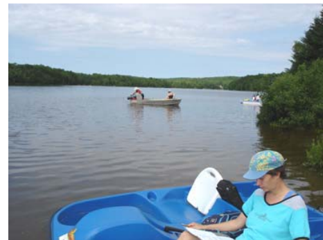
Caractérisation du substrat le 3 juillet 2006.