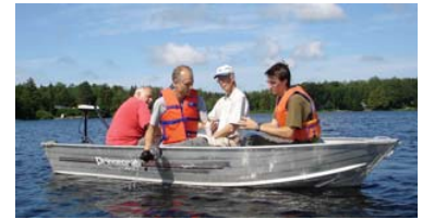
Test d'eau par Bio-Services au lac Hughes le 3 août 2006.