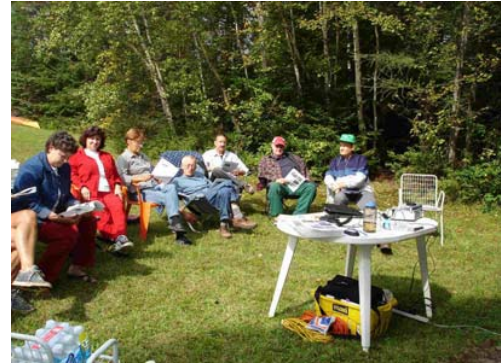
Séance d'information avec les riverains du lac Dainava le 2 septembre 2006.

Une séance d'information sur les problématiques des lacs et les résultats des analyses physico-chimiques s'est tenue à la plage du lac Dainava, et ce, afin d'aller chercher le plus grand nombre de présences. Ainsi, une douzaine de riverains ont assisté à la présentation. De plus, je suis allée porter en main propre des documents de sensibilisation à deux résidences problématiques. La propriétaire d'une de ces résidences s'engage à renaturaliser sa rive suite à mon intervention. J'avais donné l'affiche « Vivre au bord de l'eau » au président de l'association pour qu'il l'affiche sur le babillard du lac, ce qui ne semble pas avoir été fait.