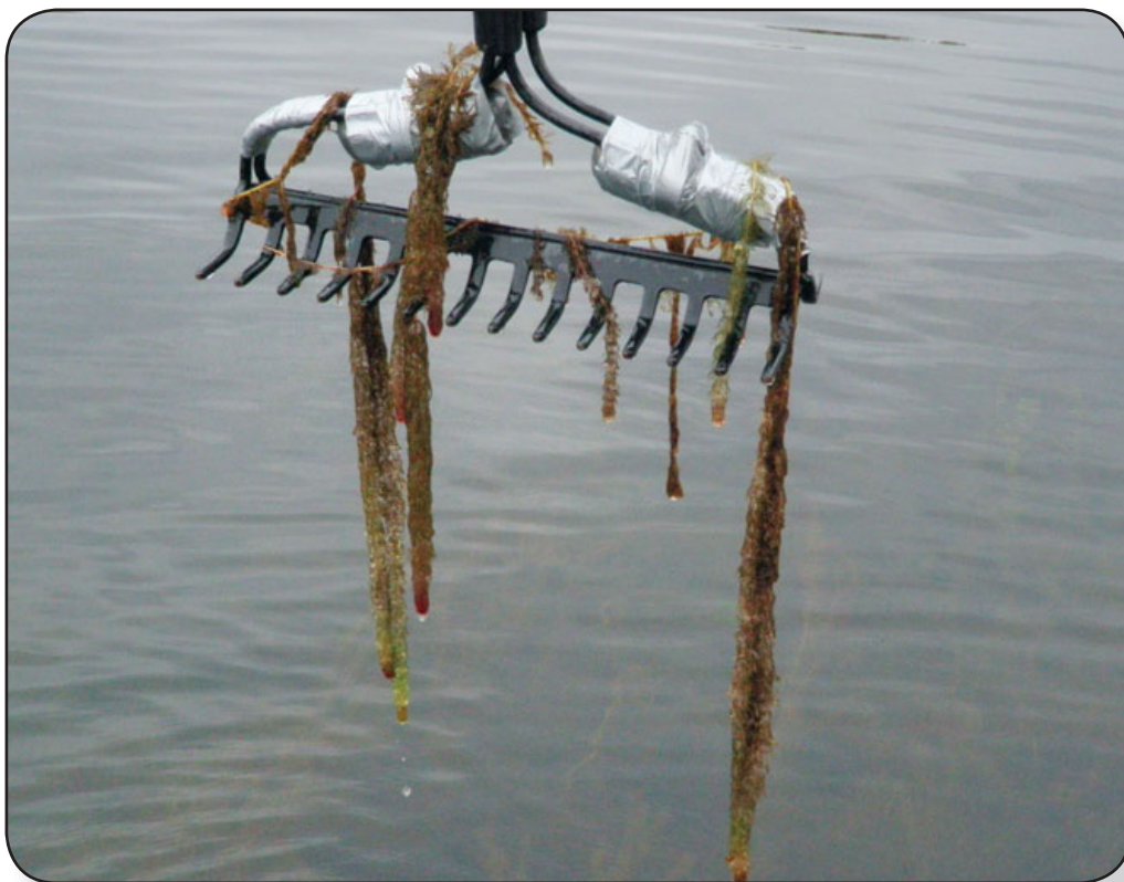
Râteau à tête double

Les plantes aquatiques sont une composante naturelle et essentielle de la zone littorale des lacs. Elles constituent un habitat important pour les poissons et les autres organismes aquatiques, de même que pour les oiseaux et mammifères qui fréquentent la zone riveraine. De plus, les plantes aquatiques produisent de l'oxygène, maintiennent les sédiments en place au moyen de leurs racines et réduisent l'érosion. Le défi de quiconque s'intéresse aux plantes aquatiques est d'observer ce qui croît sous la surface de l'eau. Ceci est particulièrement vrai pour les plantes submergées qui poussent en eau plus profonde.